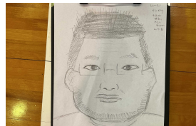
【特徴をよくとらえてます】