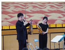
【楽器の役割の説明】