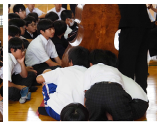
【近くで聴くとすごい響き】