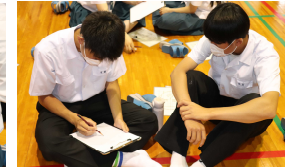
【証言をもとに描くのは大変】