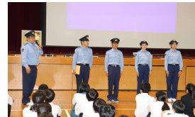
【制服姿がかっこいい！】

今後も、職業調べや職場体験学習を通じて様々な職業への理解を深め、生徒たちが将来の夢や目標を持てるような教育活動を推進していきます。