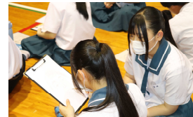
【特徴を伝えるのって難しい】