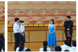
【貴重な体験ができました】

5月27日（水）、RENTARO室内オーケストラ九州の方々をお招きして、全校生徒対象の弦楽四重奏ミニコンサートを開催しました。