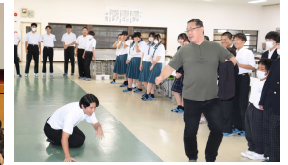
【犯人役と被害者役を熱演】