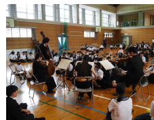
【自分の好きな場所で鑑賞】