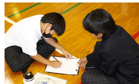
【どんな特徴だったの？】