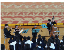
【生演奏に感動です！】