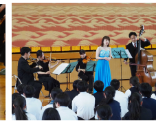
【ソプラノ歌手の美しい声】