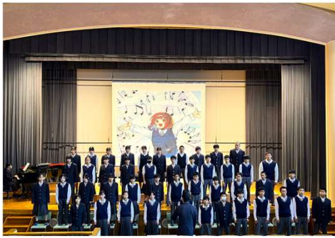
軸となる活動「合唱」