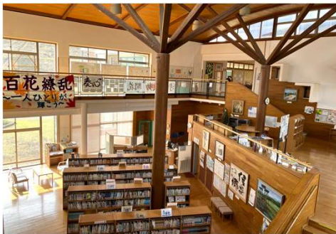
読書活動を支える図書館