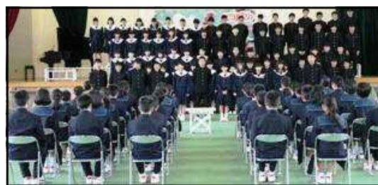
入学式では先輩たちが新入生を心温まる歌声で迎えました。

「 磨き合い 」。「あの人はすごいな」とか「自分にはムリ」ということで終わるのではなく、「あの人を追い越すんだ」「自分にもできるんだ」というレベルまで意識を高めようということです。良い意味での「切磋琢磨」を校内至る所につくりまします。もちろん、教職員も、授業力や生徒指導力をお互いに磨き合います。このような意識の中で、学力や体力の向上をめざしていきたいと思っています。