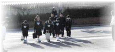
朝のあいさつの風景

「先手あいさつ」「一止（視）一礼」これが、本校のあいさつの「かたち」です。昨年度より取組が始まり、今年はその徹底とレベルアップが目標です。朝の校門では、生徒会執行部の生徒が率先して「あいさつ運動」に取り組んでいます。そして、多くの生徒たちが、「おはよう！」「おはようございます」と清々しいあいさつを交わす光景が見られます。