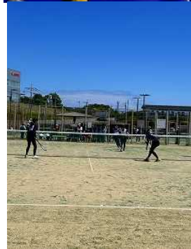
すれ行ナリ洲マコ 。まわで | ア大ダブ