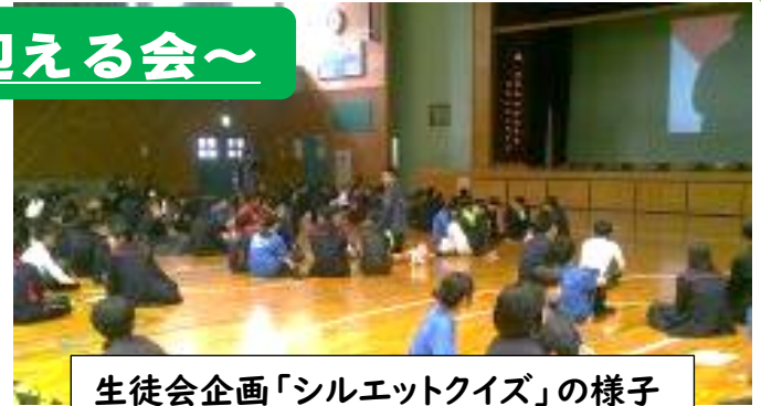
生徒会企画「シルエットクイズ」の様子

4月10日(金)、生徒会主催で新入生を迎える会が開かれました。生徒会執行部の紹介や生徒会活動の説明のあと、生徒会企画のシルエットクイズが行われました。シルエットが映し出されるたびに、何のシルエットか縦割り班の中で楽しそうに予想する姿がありました。また部活動紹介では、ユニフォームや部活動Tシャツ等を着て実際にパフォーマンスをしたり練習の様子を動画で見せるなど、部ごとに工夫を凝らして紹介していました。2,3年生の心のこもったおもてなしに1年生も楽しい時間が過ごせたようでした。会を企画し運営してくれた生徒会執行部の皆さん、そして2,3年生のみなさん、ありがとうございました。