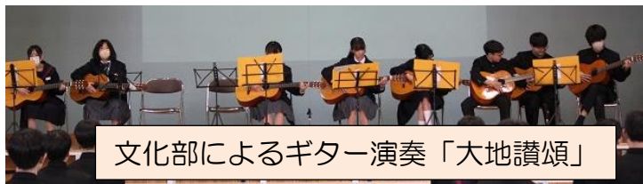
文化部によるギター演奏「大地讃頌」