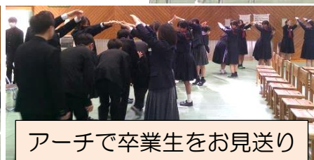
アーチで卒業生をお見送り