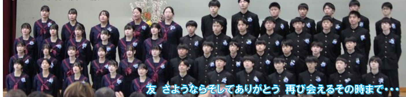
友 さようならそしてありがとう 再び会えるその時まで・・・