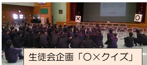
生徒会企画「〇×クイズ」

「友～旅立ちの時～」 ※卒業生は、サプライズで「大地讃頌」も披露してくれました。