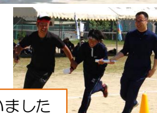
3年生は最後の若鷹祭。負けられない戦いに熱く全力で挑んでいました