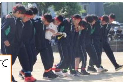
2年生は、気持ちを一つに協力して取り組んでいました