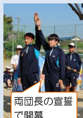
両団長の宣誓 で開幕

5月13日(火)は好天に恵まれ生徒会主催で若鷹祭が行われました。生徒たちは、今年度のテーマである「さいこう～輝け 全員が主人公～」のように全力で競技や応援に臨み、その姿はみんな光り輝いていました。そして、本番の結果だけでなく、練習や準備にひたむきにがんばっていた人、リーダーシップを発揮していた人、励ます声かけをしてくれた人、一緒に喜んでくれた人など、こんながんばりをしてくれた人がたくさんいたから、さいこうの若鷹祭になったと思っています。みんなありがとう！