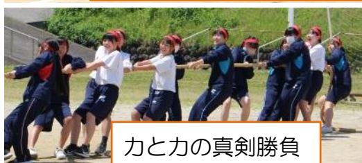
力と力の真剣勝負