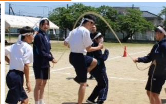
掛け声に合わせて、リズムよくジャンプ