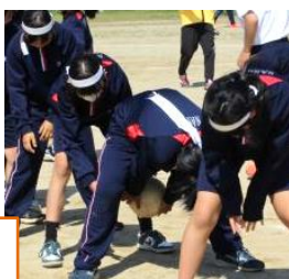
1年生は初めての若鷹祭。楽しく一生懸命に参加していました