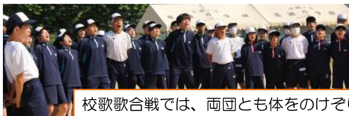
校歌歌合戦では、両団とも体をのけぞり大きな声で熱唱！勝者は白団(写真左)