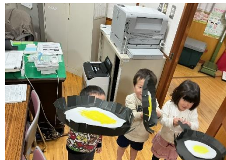
幼稚園児今回の工作「めだまやき」。丸いフライパンの形にするための見事なはさみづかいに注目!

毎朝、さわやかにあいさつをしながら玄関に駆け込む中学生のみなさん。すがすがしいあいさつがすてきです。そのあとの朝読書の時間はとても静か。めりはりがすばらしい!