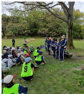
中3と小6の子どもたちがレクを企画しました。頼れるカッコいいリーダーです。