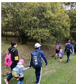
中学生と園児が手をつないで。東山ならではの光景です。

全員レクでは、中学3年生と小学6年生がそれぞれ知恵をしばり時間をかけて準備をしたゲームを行い、友だちと協力し合いながらこれまで以上に仲を深めることができました。レクのあとは、お待ちかねのお弁当&おやつタイム！自然の中で友だちと食べるお弁当とおやつは、いつもよりスペシャルな味だったようです。