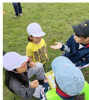
グループでのクイズラリー。幼小中みんなで力を合わせます