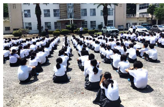
（グラウンドへ避難する生徒たち）

訓練後の講評では、生徒たちへ「災害から命を守るためには、正確な情報が必要です。災害が発生した場合、校内放送で『どこで、何が起きたのか』が知らされます。この情報を正確に聞き取ることが、自分の命を守る第一歩となります。」と伝えました。近年、県内でも台風や大雨などによる自然災害が毎年のように発生しています。生徒たちにはどんな状況でも自分の命を守るための判断力と行動力を身につけてほしいと願っています。