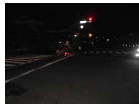
対向車も青信号で右折して来る

「秋分の日」が過ぎて日没時間が早くなりました。二中前交差点も、18時30分過ぎから暗くなります。この交差点信号の「歩車分離」は、朝の時間だけです。夕方は、対向車線も同じ青信号です。対向の右折車には十分注意しましょう。そして、ヘルメットの反射材が暗闇の中の貴重な目印になります。