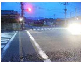
二中前交差点 (18時30分)