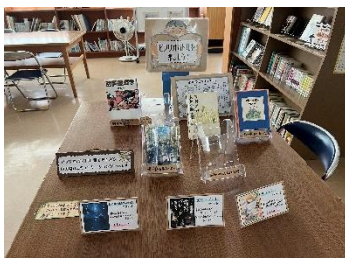
図書館のビブリオバトルコーナー