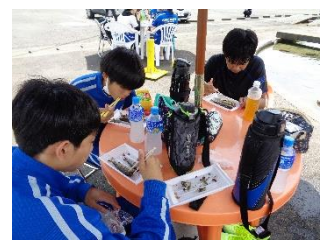
焼いた鮎をいただく