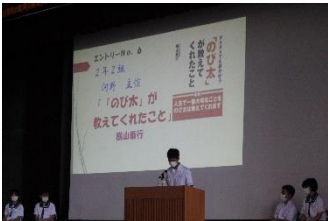
バトラーによる本紹介