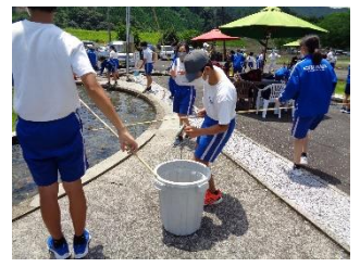
たくさん釣れます