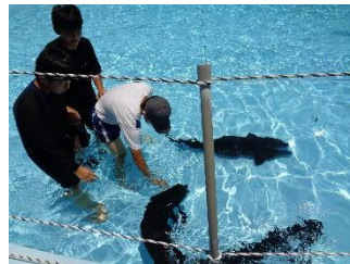
チョウサメのプール