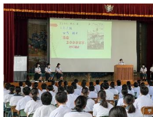
全校での大会の様子