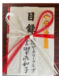
ロータリークラブからの寄付