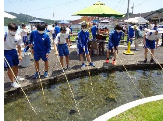
ちよん掛けの様子

7月13日、3年生は、番匠川漁協組合のご支援により、伝統漁法「ちよん掛け」を体験しました。鮎の習性などレクチャーしていただき、20匹以上釣る生徒もいました。炭火で焼いた鮎を生徒たちはおいしくいただきました。弥生の伝統と豊かな自然の恵みを体感できました。