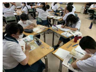
現在の班活動の様子

①お名前 ②どんなふうすごいのか(推薦理由) ③連絡先を教えてください。もちろん、保護者の皆さんご自身でもおじいちゃん・おばあちゃんでも大歓迎です。お一人ではちょっと・・・という場合は複数の方でも良いです。7/13(月)までに教えていただくと幸いです。2学期に入ってから「すごい人へのインタビュー」を予定しています。よろしくをお願いします。