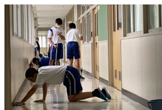
黙掃から気づき清掃へ