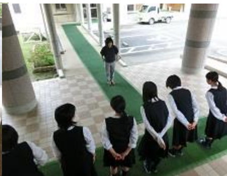
担当職員による 指導と評価！