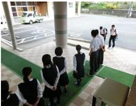
生徒会執行部による 朝の挨拶運動