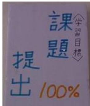
2年生 学習目標 準備万端で授業に臨む！