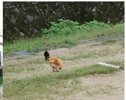
にわとり も 挨拶運動？