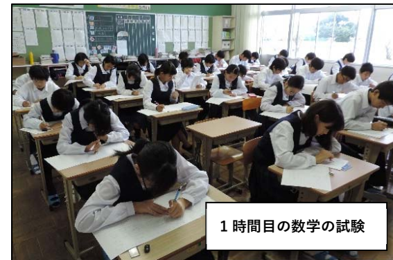
1時間目の数学の試験

おきましょう(テスト前にやれたらよかったんでしょうが...遅れても、あきらめずにゴールまでたどり着いておこう!)