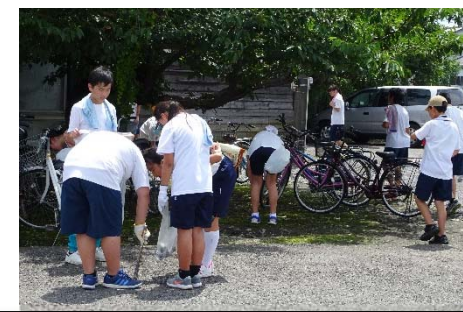
2016年度のグリーンアップ今津の一場面(今津駅付近)

「拾う」行動は、確実に「捨てない」人を作ります。人のため、地域のために動ける人は、汗をかいて頑張る人の気持ちが理解できる人になれる。みなさんも、毎日の清掃活動の意味を改めて考えるためにも、一緒にひと汗かいてみよう。