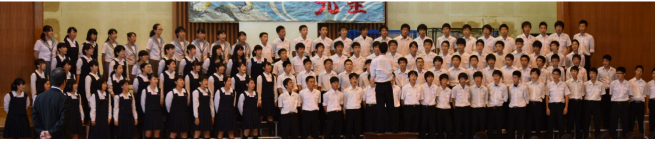
【9月16日のリハーサル。どの学年も良かったが特に3年生はすごさをみせた(上記写真)。感動をありがとう】