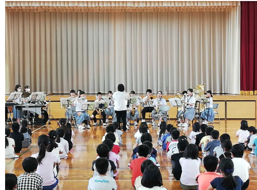
小学生も手拍子をしながら楽しんでくれました