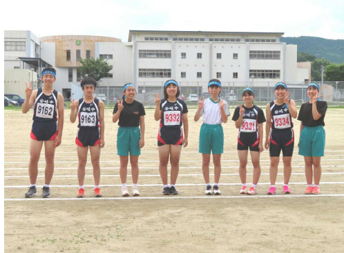
気持ちを切り替えて挑んだ陸上部3年生