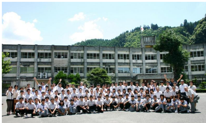
真夏の酷暑の中、自分の机と椅子を移動しました。

老朽化し、耐震基準を満たしていないことなどからも、校舎が新しく生まれ変わります。来年の11月には新校舎で学習ができる予定です。3年生は新校舎で生活できませんが、完成したら是非見学に来てください。